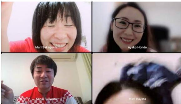
同窓会のスクリーンショット。画像が乱れてアプリを変更後、仕事を終えたOVI人も合流した（筆者：画面左下）

この同窓会は、2010(平成22)年度の元青年海外協力隊有志を中心に2013年に大阪で発足。以来、都内のマレーシア料理店をはじめ、京都や佐賀などOVと縁のある飲食店でほぼ毎年春か夏に開いてきました。時には、OV家族やシニア海外協力隊の他にJICAの企画調査員や専門家、派遣前訓練所の語学教師など当時の隊員と親交のあったメンバーも加わり、毎回5～10人が集まっています。